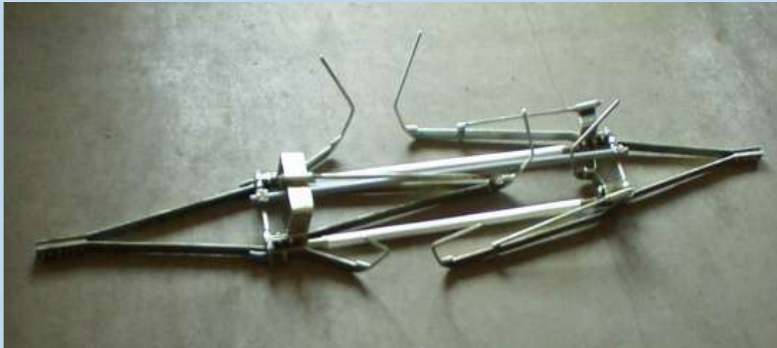
Izolator de sectionare