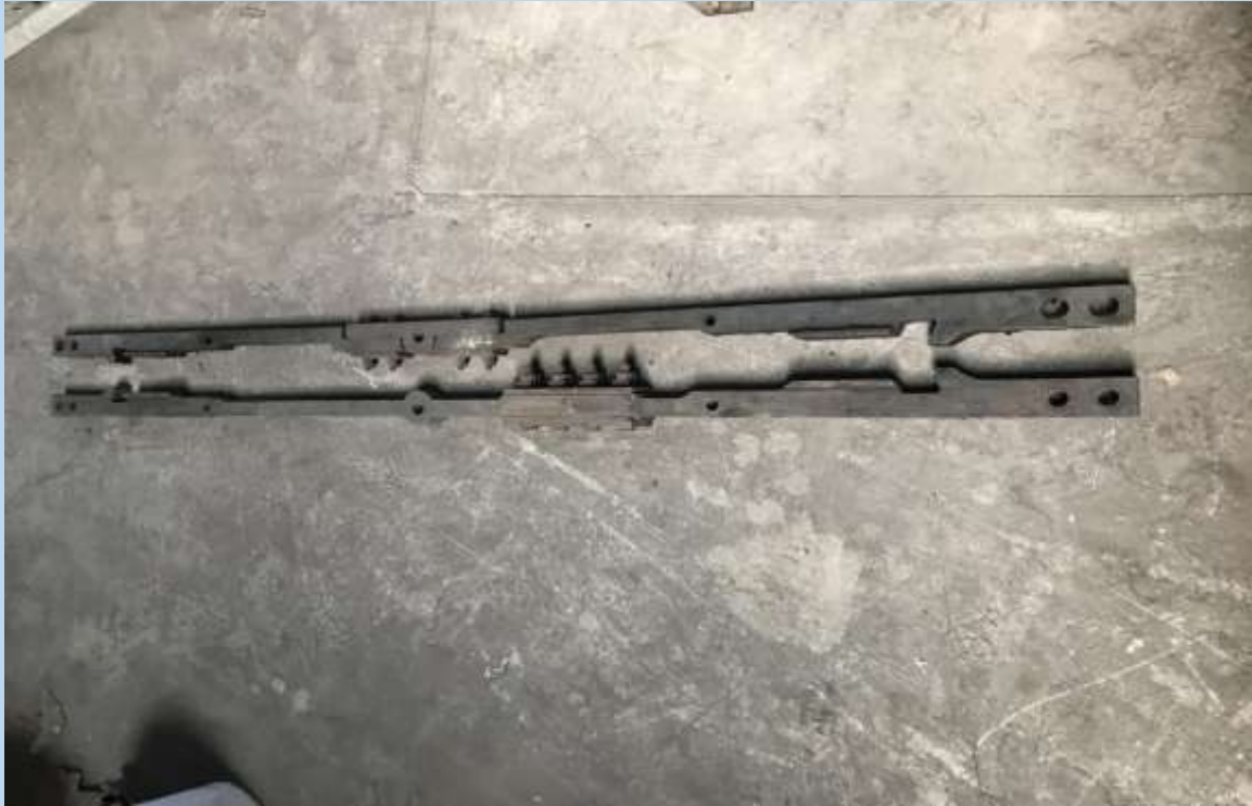
Fixator de varf