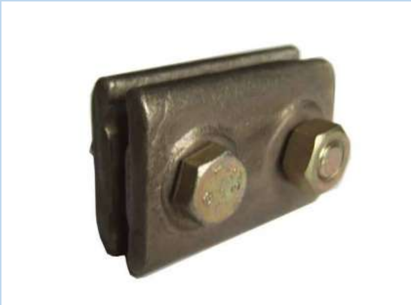
Clema de legatura electrica pe CP